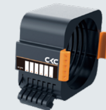
色片夹灯头 可同时放 6 张色纸